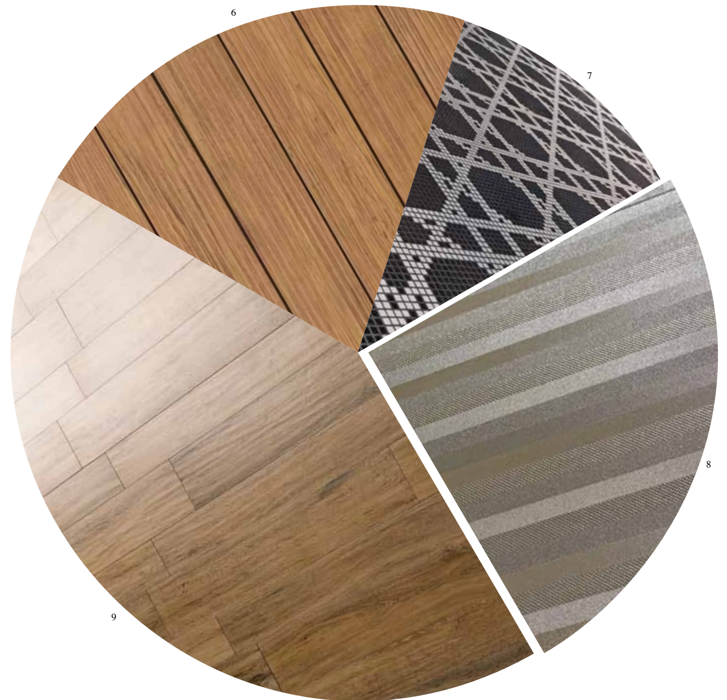
Laminat, Keramik und Linoleum (s. auch S. 28): Um die Imitate von Papier, Metall und Leder als solche entlarven zu können, muss man genau hinschauen. Holz wird beispielsweise auch haptisch durch Furchen und Kratzer nachgeahmt.