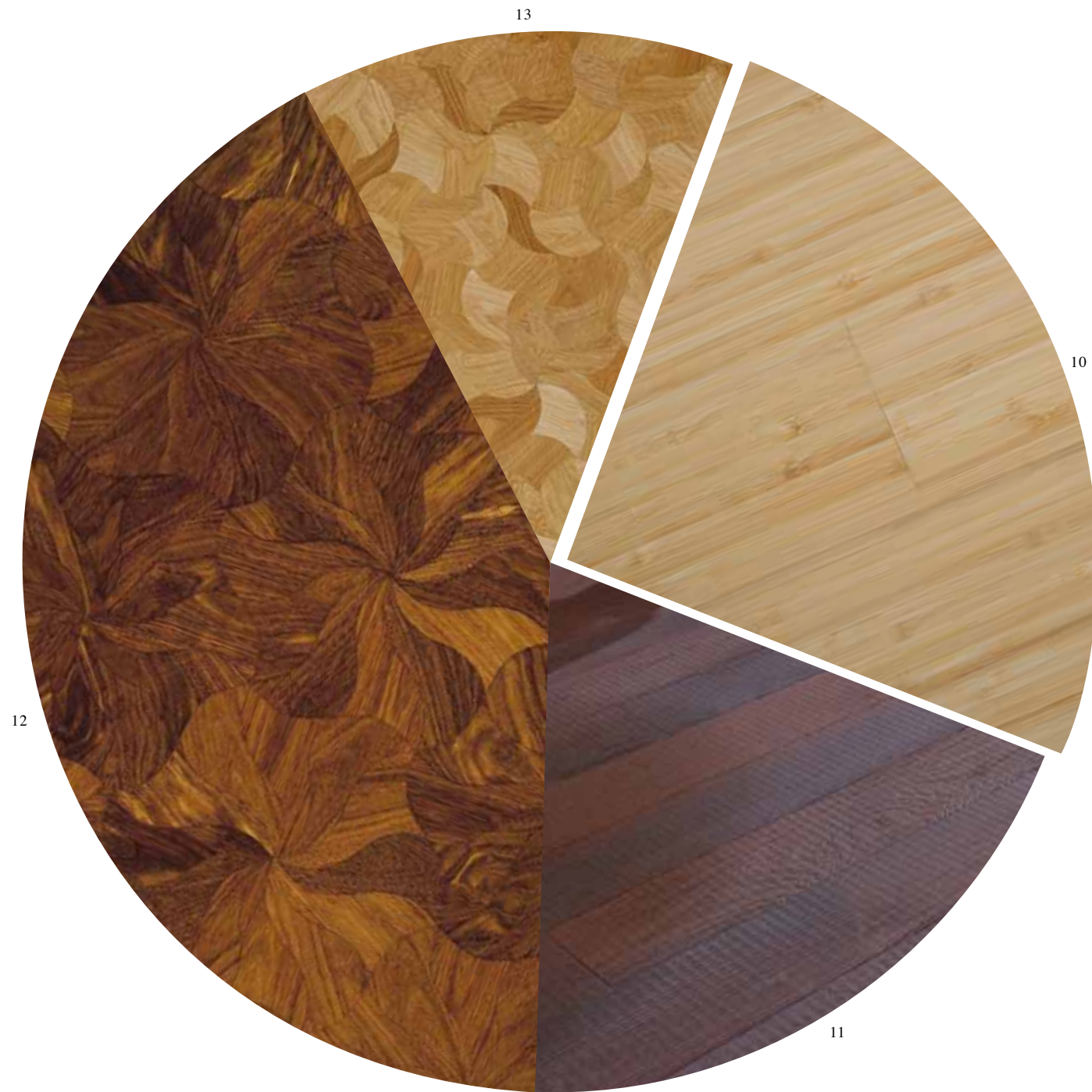
Wohnrevue 4 2011