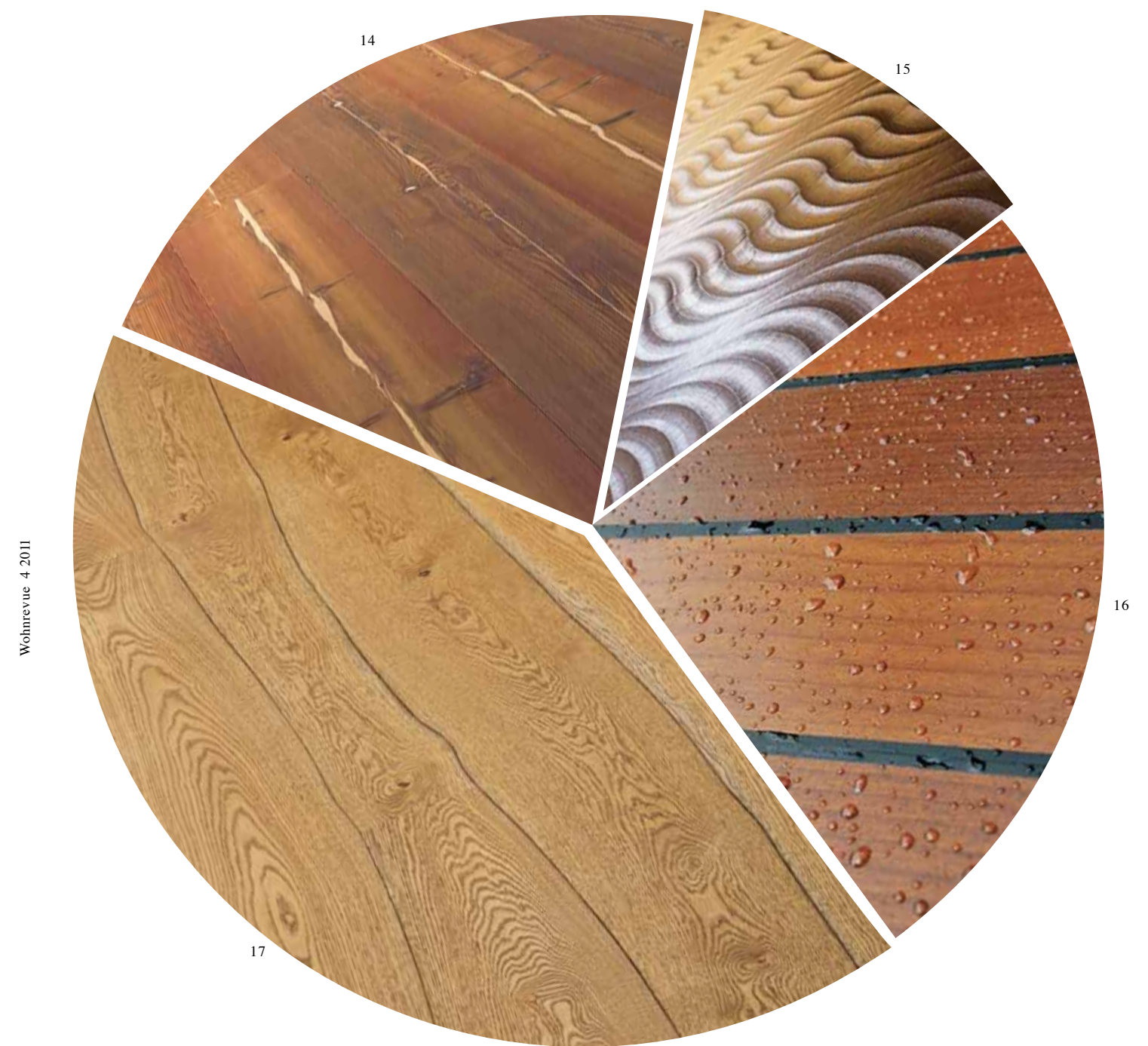
Wohnrevue 4 2011